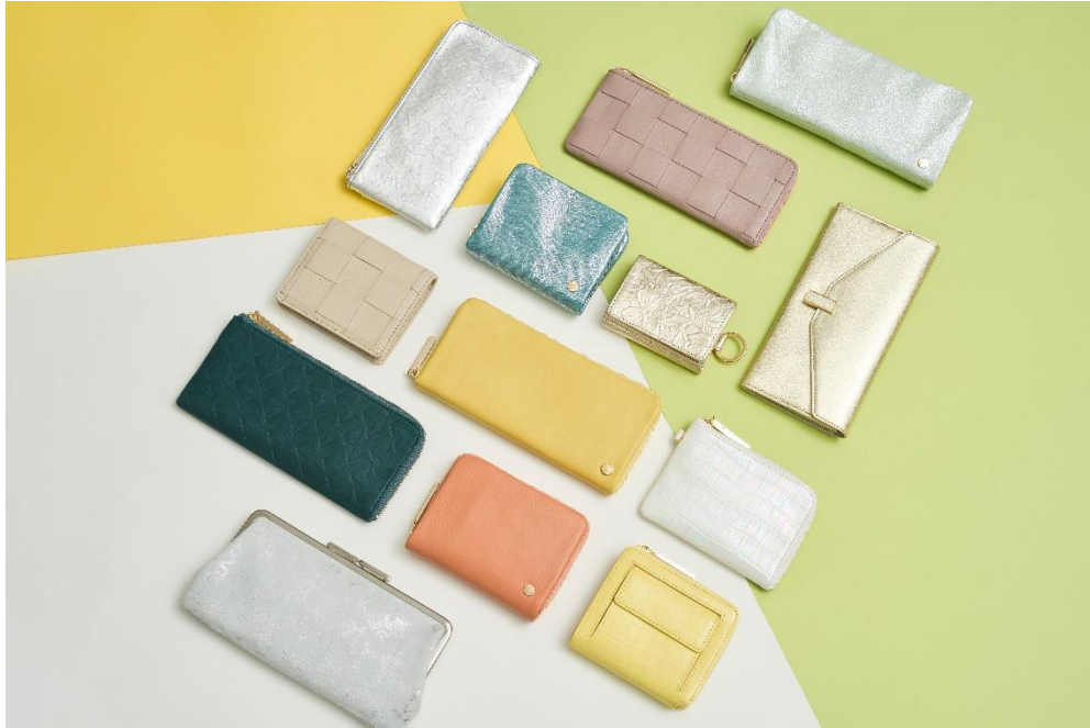
ウォレット 各種 ¥11,000～¥17,600(税込)

株式会社レイジースーザン(東京都港区/代表者:春日政彦)は、大人気占術家カウチサさん監修による、2024年の最強カラーやマテリアルを活かしたウォレットや、上下左右につながり続くモザイク柄をはじめ2024年のラッキーデザインが施されたものなど、“福”と“運”を呼ぶ新作ウォレットを多数揃えました。収納力や機能面はもちろん、ディテールにまでこだわったウォレットから、金運と幸運を呼び込むあなたにぴったりの開運財布を手に入れて、素晴らしい2024年を迎えましょう！