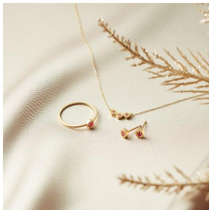
気品溢れる愛されカラー【Ruby】