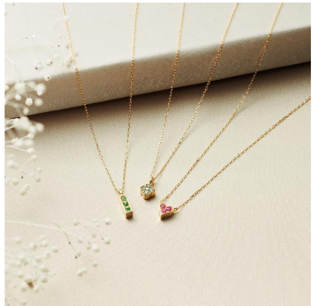
表と裏で違う表情を楽しめる【Reversible】