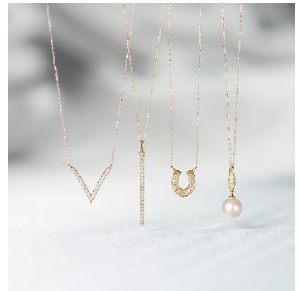
ビビットきたモチーフを選ぼう【Various】

「Jewelry Holiday Collection 2023」オンラインストア特集サイト https://shop.lazysusan.co.jp/blogs/featured-article/lp-2311-1