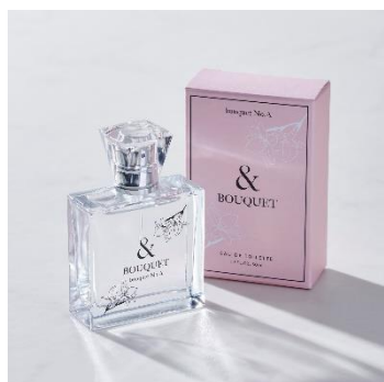
bouquet No.A オードトワレ 50ml ¥6,930