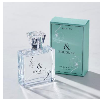
secret flora オードトワレ 50ml ¥6,930

繊細で透明感のあるフリージアの香りをシグネチャーノートに、フレッシュグリーン、ジャスミン、高級感のあるマリーゴールドと上品なマグノリアのエッセンスが、清潔感のある洗練された美しい香りのハーモニーを奏でます。