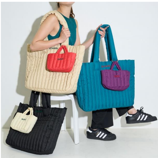
オヤコバッグセット 各¥9,900