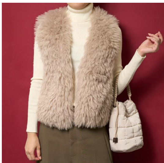
ファーベスト(ショート) ¥12,100