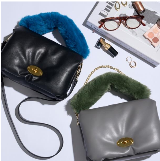
ショルダーバッグ 各¥11,880