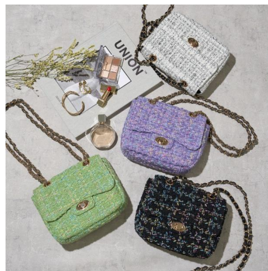
ツイードバッグ 各¥10,450