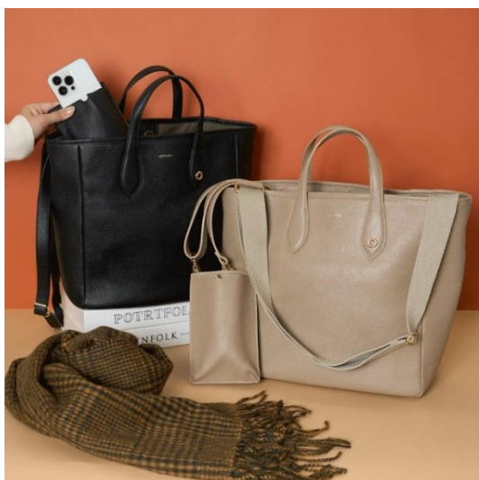
レザートート(スマホショルダー付) 各¥29,700