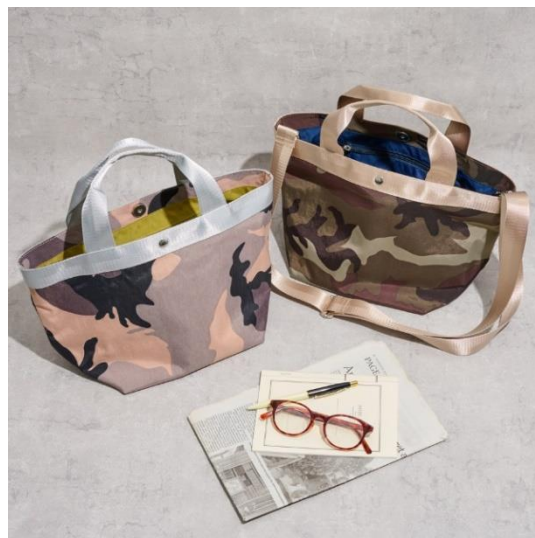
ナイロンバッグ 各¥8,250