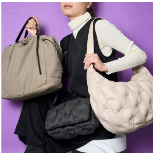
左から ナイロンバッグ(グレー) ¥15,950 ショルダーバッグ(ブラック) ¥16,500 ビッグバッグ(ホワイト) ¥17,600 ※すべてハンドル部分はレザー仕様