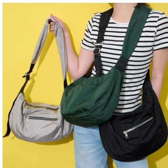
ナイロンショルダー 各¥7,920