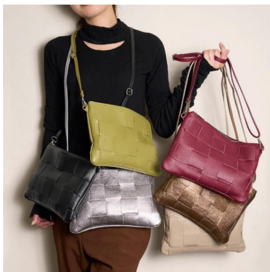
レザーショルダー各¥14,300 シルバー、ブロンズのみ 各¥15,400 ※ベージュ、ワイン、ブロンズは店舗限定カラー