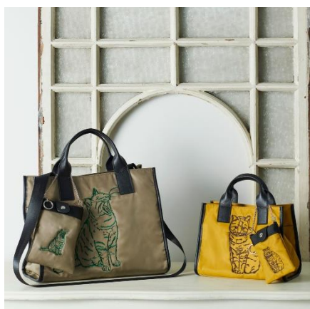
トートバッグ(大) ¥11,000 トートバッグ(小) ¥9,350

レイジースーザンでは、可愛く愛くるしいネコアイテムで『ネコの日』を盛り上げ、お楽しみいただきながら、対象のトートバッグにはチャリティタグをお付けし、この活動を広めてまいります。