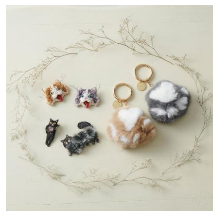
バッグチャーム 各¥3,300 ポーチ 各¥3,300～