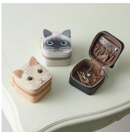
ジュエリーケース 各¥5,720