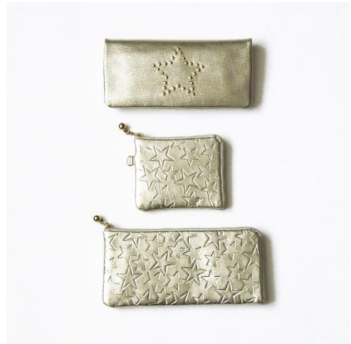
(上から)ウォレット ステラ¥14,000、ウォレット スター(ショート)¥6,000、(ロング)¥12,000

キラキラと華やかに、新しい1年を迎えるにあたり特別なパワーを与えてくれそうな縁起財布にぴったり★