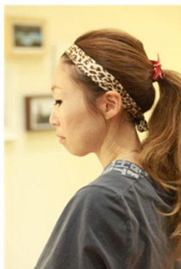
ヘアバンドとして